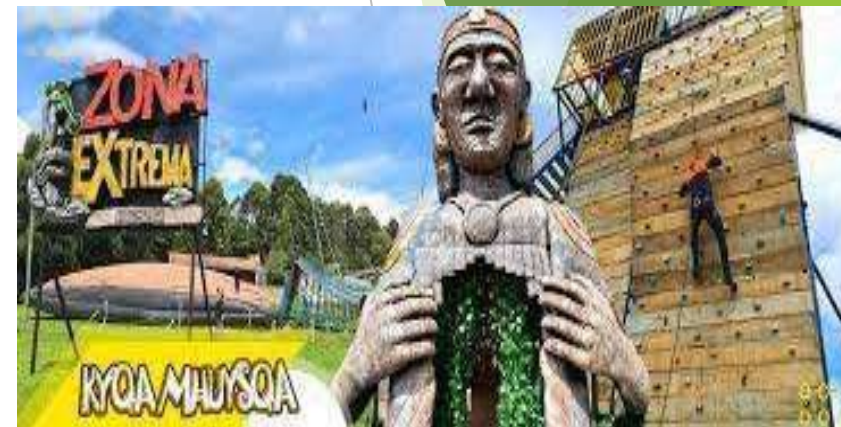
Facativá – Contiguo al Parque Arqueológico Piedras de Tunjo.

Nota: La boletería se debe solicitar previamente (mínimo 8 días de anterioridad) indicando fecha de visita del parque y datos de titular para poder generar la reserva.